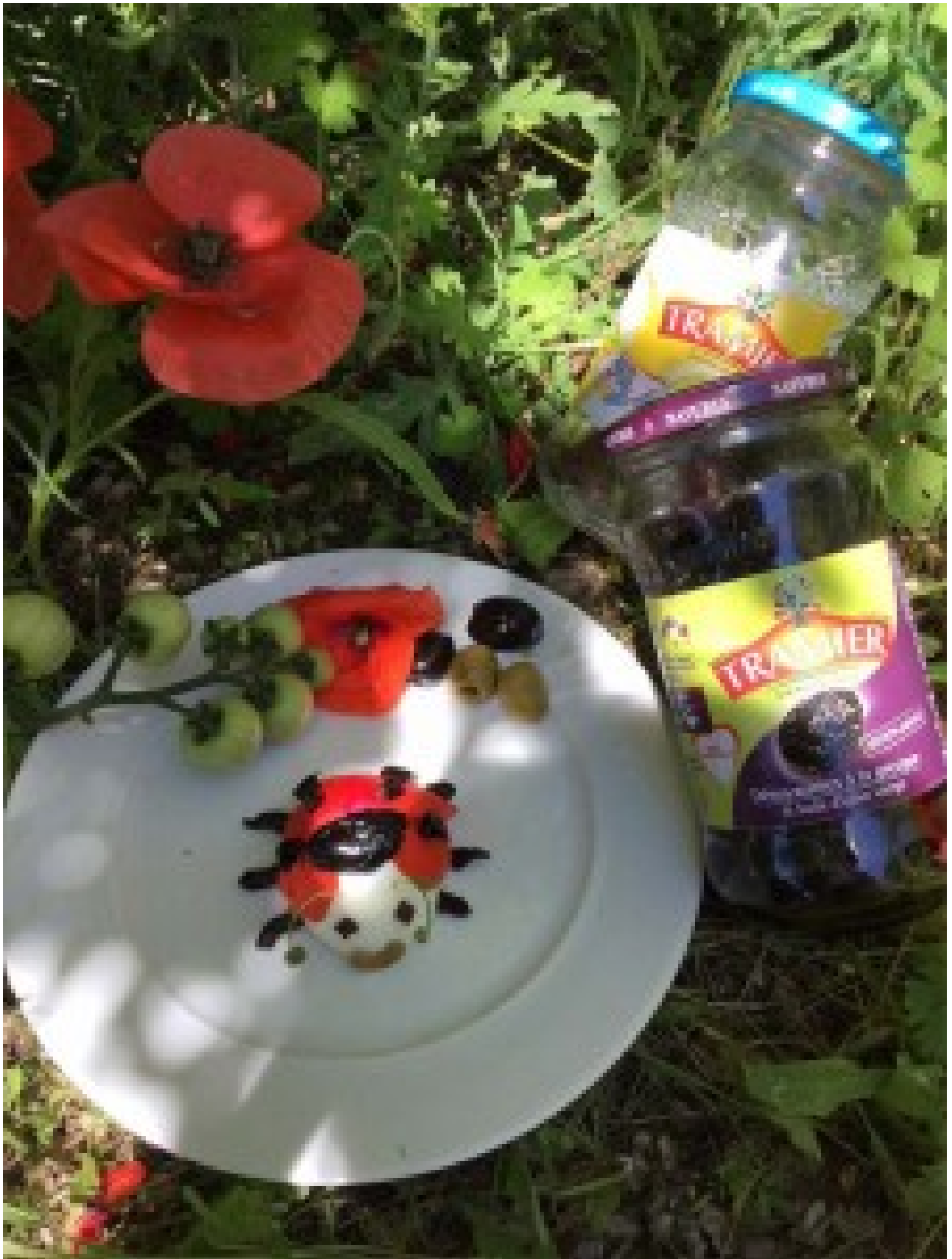
Elle gagne un panier gourmand composé de 3 produits Tramier !