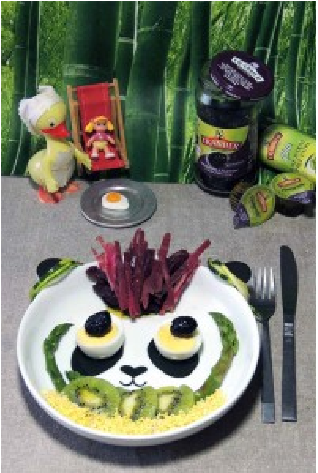
Il gagne un panier gourmand composé de 3 produits Tramier !