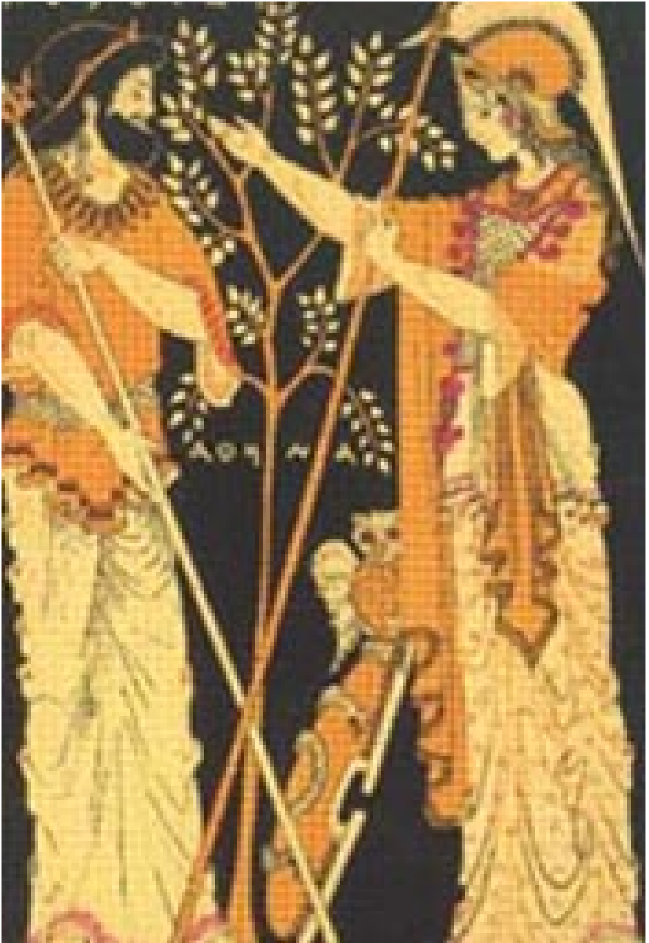
L' olivier sauvage , appelé oléastre , est présent dans de nombreuses régions du pourtour méditerranéen (oriental et occidental) depuis les dernières glaciations. Les premières